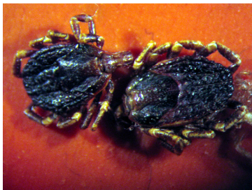
Hyalomma lusitanicum é a única carraça frequente. Praticamente não se fixa no Homem e não é conhecida como um transmissor de doenças humanas